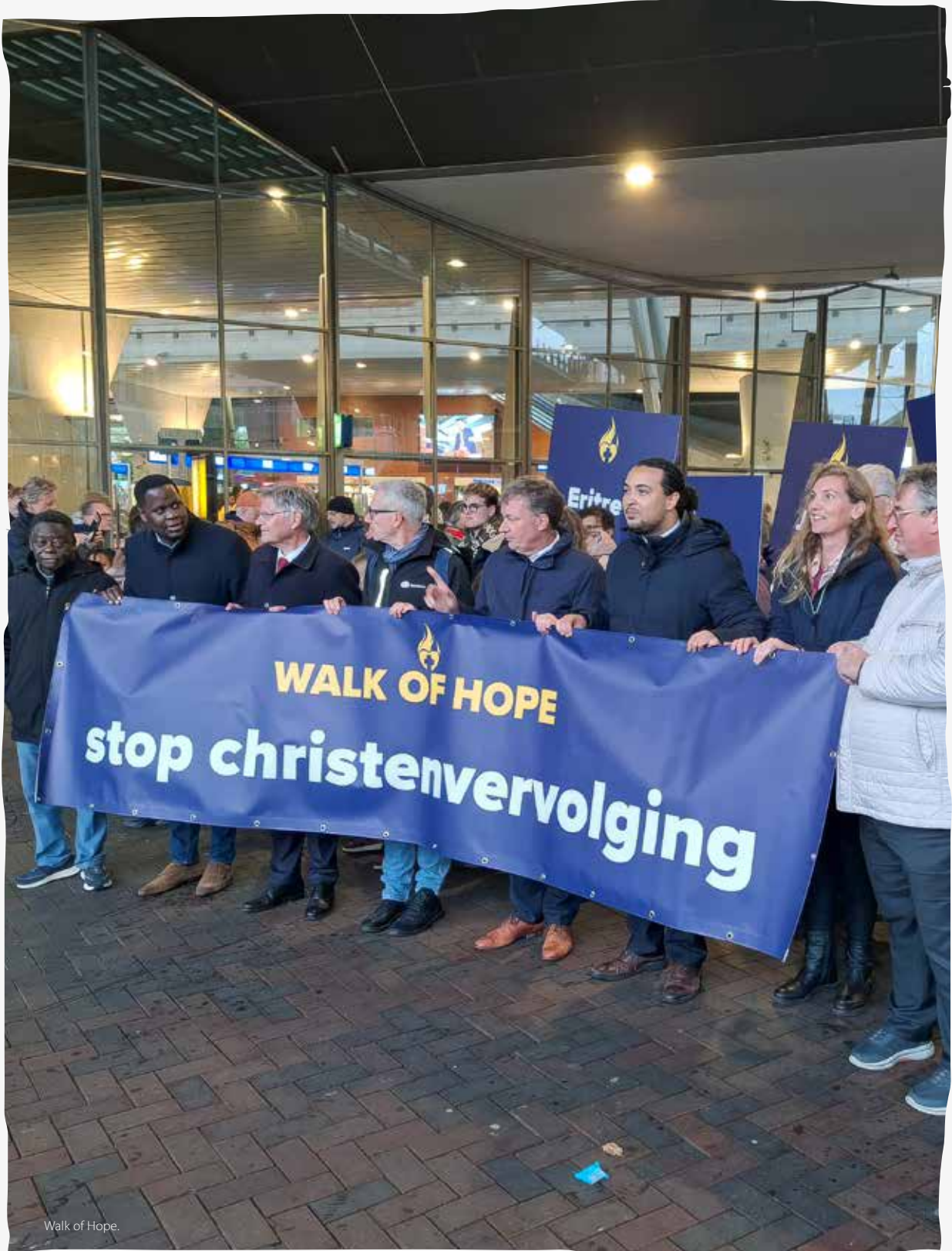
Walk of Hope.